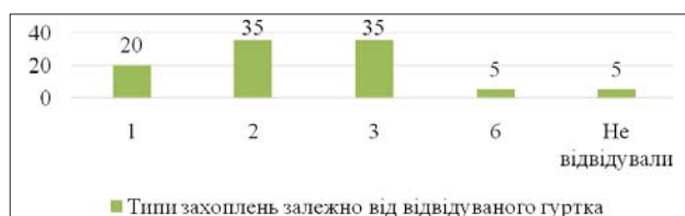
Рис. 1. Відсоткове співвідношення респондентів залежно від типу захоплень (гуртки, секції, відвідувані підлітком у минулому)

Результати представлені нижче на рис. 1.