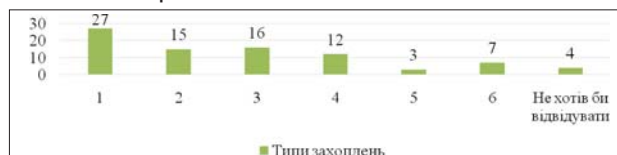
Рис. 3. Відсоткове співвідношення респондентів залежно від типу захоплень (гуртки, секції, які підліток хотів би відвідувати)

Бажані гуртки, секції та факультативи представлені на рис. 3.