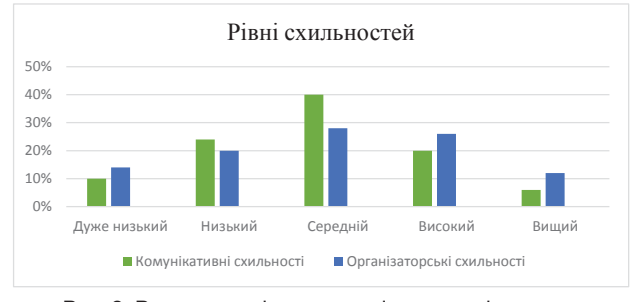
Рис. 2. Результати діагностики рівня комунікативних і організаторських схильностей за методикою «Комунікативні й організаторські схильності» (В. Синявського і В.Федорошкина)

Результати методики «Комунікативні й організаторські схильності» В. Синявського і В.Федорошкина відображені на рис. 2.