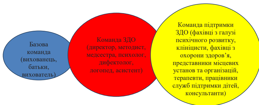
Рис. 3. «Команда супроводу дитини з ООП на базі ЗДО «Барвінок»

навчання; створено модель вертикалі управління щодо впровадження освітньої інклюзивної практики в діяльність дошкільних навчальних закладів та успішна її апробація.