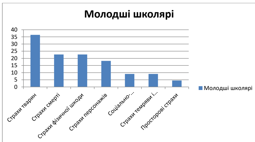
Рис. 1. Розподіл відсотків різних видів страхів у молодших школярів

Отже, для дітей молодшого шкільного віку характерна наявність значної кількості страхів. Це може бути пов'язано з особливостями вікового розвитку й опанування нових соціальних ролей. Загалом у вибірці дітей простежується високий